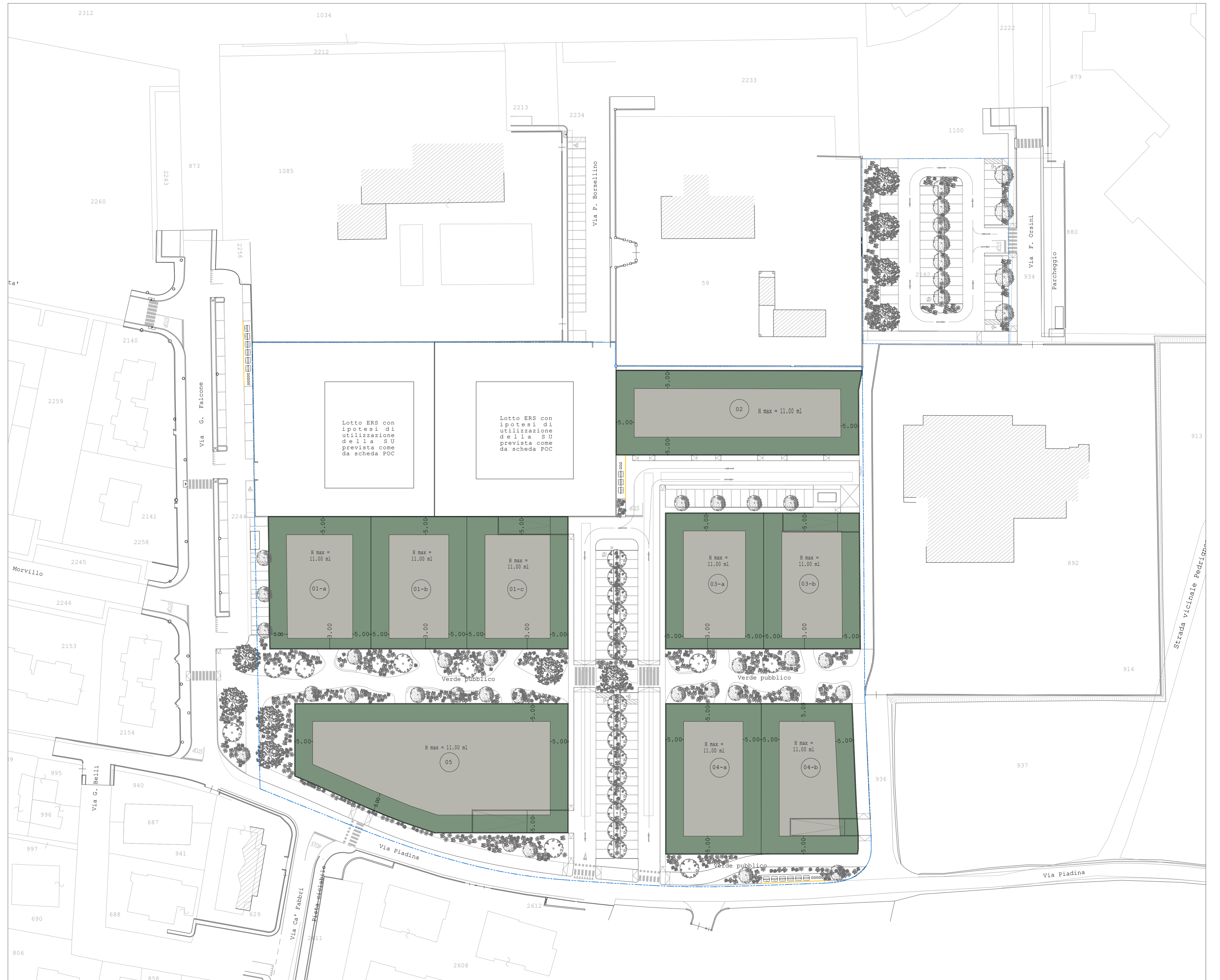
Planimetria 1:500 - Planimetria generale di progetto con individuazione delle aree di massimo ingombro

DIRITTI DI PROPRIETÀ: Su questo elaborato grava il diritto di proprietà, pertanto è vietata la cessione, la diffusione e la proiezione anche parziale del presente elaborato senza autorizzazione scritta. Ogni violazione sarà perseguita ai sensi di legge.